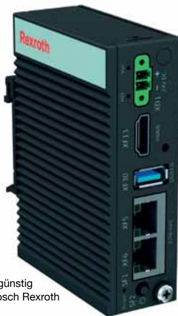
Bild 3: Vorhandene Maschinen und Anlagen kostengünstig vernetzen: Das gelingt mit dem IoT-Gateway von Bosch Rexroth