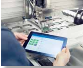
Bild 8: Beim Smart Gripping erfasst der intelligente Greifer von Schunk prozess-integriert in Echtzeit und ohne Einsatz externer Sensoren Angaben zur Größe des Bauteils, zu dessen Beschaffenheit und Zustand

fassenden Ausbau, wie es für eine durchgängige Digitalisierung erforderlich ist.“