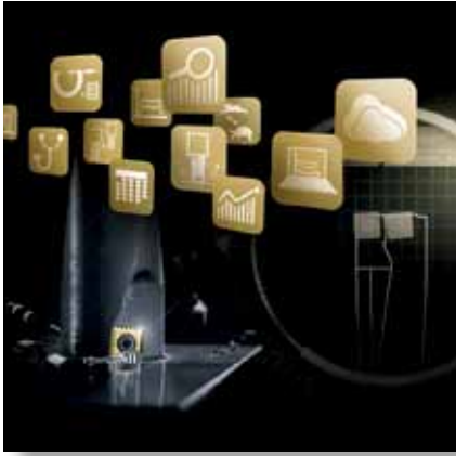
Bild 4: Das Assistenzsystem „Toolscope“ von Ceratizit nutzt Methoden der Künstlichen Intelligenz für die Werkzeugmaschine: Es erkennt beispielsweise automatisch Werkzeugbrüche, regelt adaptiv den Vorschub oder koppelt Werkzeugdaten auf Cloud-Server aus