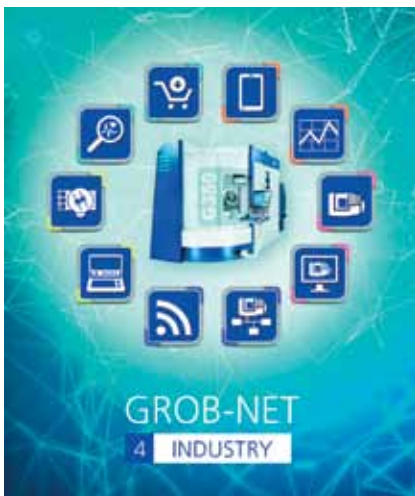
Bild 6: „Grob-Net4Industry“ ist die Antwort von Grob auf die Herausforderungen durch Industrie 4.0: Es schafft mittels Webtechnologie werksübergreifend Konnektivität und Transparenz im Produktionsprozess“