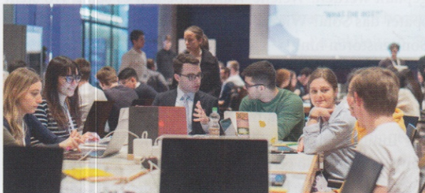
Begleitet von fünf Innovations-Coaches arbeiten die Teilnehmenden in Gruppen an herausfordernden Fragestellungen rund um die Künstliche Intelligenz.