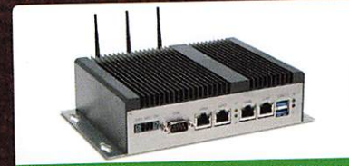
Syslogic Seite 178 Industrie-PC für IoT-Edge-Anwendungen