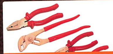
Denios Seite 150 Werkzeug funkenfrei