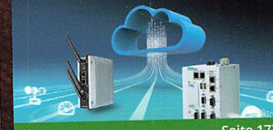
Moxa Seite 177 Gateways mit Microsoft Azure IoT Edge