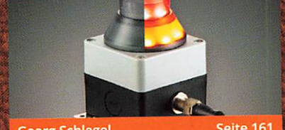
Georg Schlegel Seite 161 Not-Halt-Geräte