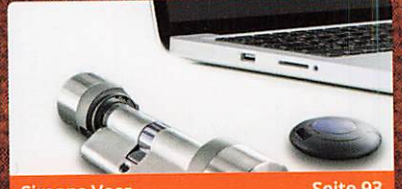
Simons Voss Seite 93 Digitaler Schließzylinder