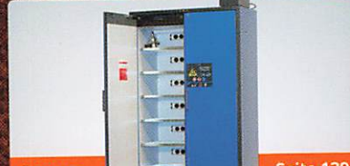
Asecos Seite 139 Sicherheitsschrank