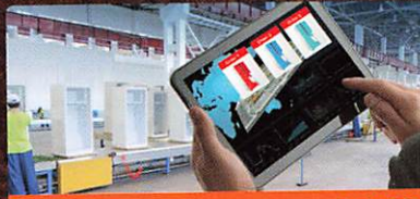
Moxa Seite 58 IIOT