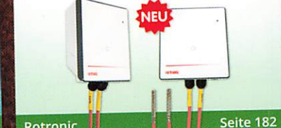
Rotronic Seite 182 Datenlogger für PT100-Fühler