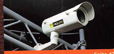
Aasset Seite 47 TKH SIQURA