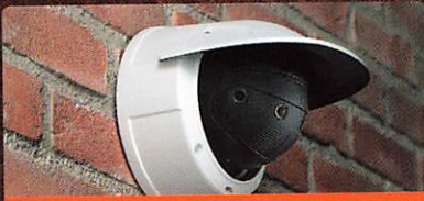
Axis Seite 84 Panoramakamera