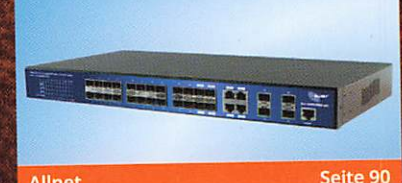
Allnet Seite 90 ALL-SG8928M