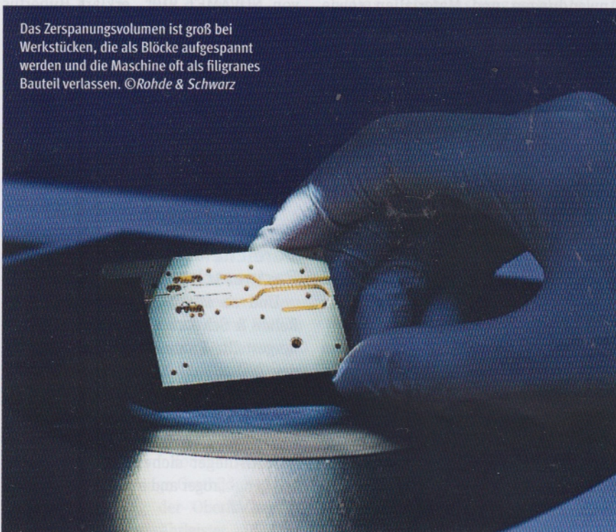
Das Zerspanungsvolumen ist groß bei Werkstücken, die als Blöcke aufgespannt werden und die Maschine oft als filigranes Bauteil verlassen.

Das war vor Oemeta nicht so. Denn die Situation am Standort ist besonders, und die auf die Zerspanung folgenden Prozesse stellen eine hohe Anforderung an den KSS. So ist das Wasser im