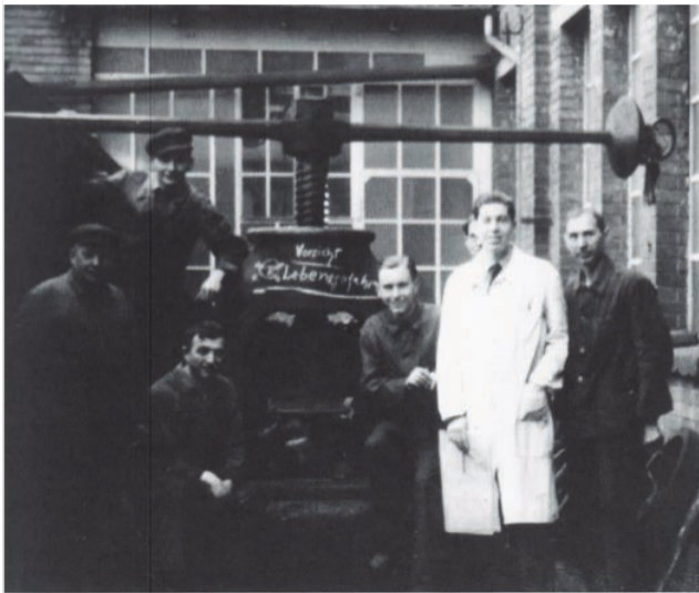
Hans-Paul Kaysser (1919–1981) im weißen Arbeitsmantel: In einer Hinterhofwerkstatt in der Stuttgarter Böheimstraße gründet er 1947 den heutigen Komponenten- und Systemlieferanten der Metallbearbeitung.

Fertigung, vollautomatische Metallbearbeitung und Dienstleistungen rund um die Produkte. Bearbeitet werden Stahl, Guss, Edelstahl, Titan, NE-Metalle und Aluminium in allen Variationen. Was nicht selbst produziert wird, steuern langjährig verbundene Partner aus der Region bei. Dadurch sind die Schwaben auch in kritischen Zeiten lieferfähig.