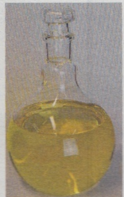
Die Neuentwicklung: Multidraw CU MFT.