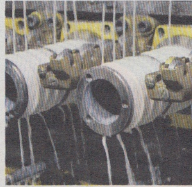
Multidraw CU MFT im Einsatz beim Kunden

Halle 6, Stand J13