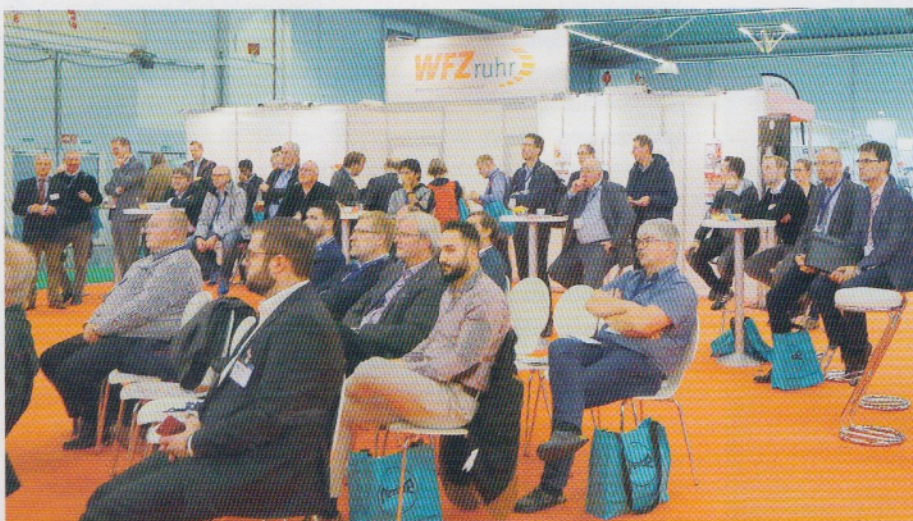
Abb. 2: Mit 6254 Besuchern festigte das Messeduo Solids und Recycling-Technik 2018 in Dortmund seine nationale und internationale Bedeutung. ▼