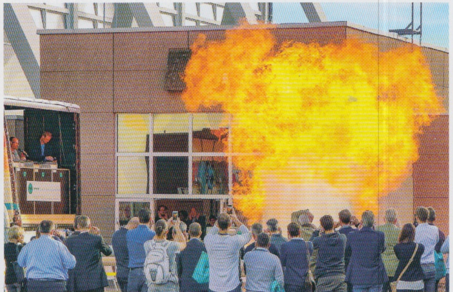
Abb. 1: Als wahrer Zuschauermagnet auf der Solids und Recycling-Technik erwiesen sich die Schauexplosionen.

Neben den zahlreichen Innovationen der Aussteller begeisterten die Besucher die informati-