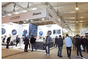
Auf den DST treffen sich Kenner der Zerspanszene

Groß ist das Interesse an der Fachmesse DST Dreh- und Spantage Südwest, die vom 29. bis zum 31. März 2023 in Villingen-Schwenningen stattfindet. Die vier Messehallen sind mit 184 Ausstellern ausgebucht, und die Warteliste wird