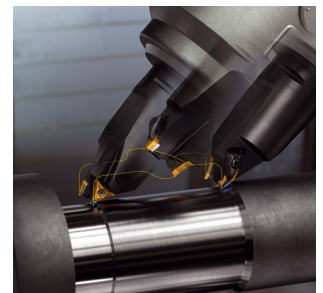
Mit PrimeTurning kann man Längs-, Plan- und Profildrehen mit einem Tool

www.sandvik.coromant.com , www.camworks.com