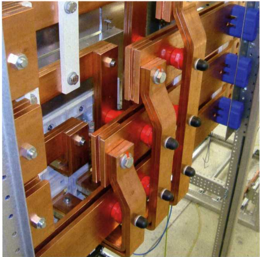
Bei den Prüfungen zum Bauartnachweis wurde eine völlig neu konstruierte Kupplung eingesetzt. Sie erreicht mit einer hohen Kurzschlussfestigkeit von 100 kA Icw 1 sec auf Antrieb einen Rekordwert.

Die Vamocon-Niederspannungs-Schaltanlagen verfügen jetzt über Bauartnachweise nach der neuesten IEC-Norm 61439, und das mit mehreren unterschiedlichen Leistungsschaltern. Die Anlagen des Herstellers Sedotec, die mit Leistungsschaltern aller namhaften Hersteller kombinierbar sind, zeichnen sich vor allem durch hohe Kurzschlussfestigkeit und volle Bemessungsströme im Feld aus. Das vermeidet eine Überdimensionierung bei der Auslegung der Anlagen. Zusammen mit einer neuartigen Kupplung, die bis zu 120 kg Kupfer einspart, beweisen die Ladenburger erneut ihre Innovationskraft. Mit dem ersten unabhängigen Schaltschrankprogramm für Niederspannungs-Schaltanlagen 2007 hat Vamocon nach eigenen Angaben seinerzeit die Branche revolutioniert.