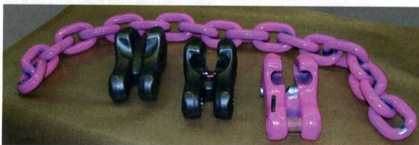
Verkürzungsklauen aus CrNiMo-Edelstahl, um die Ketten an beliebiger Stelle zu verkürzen.