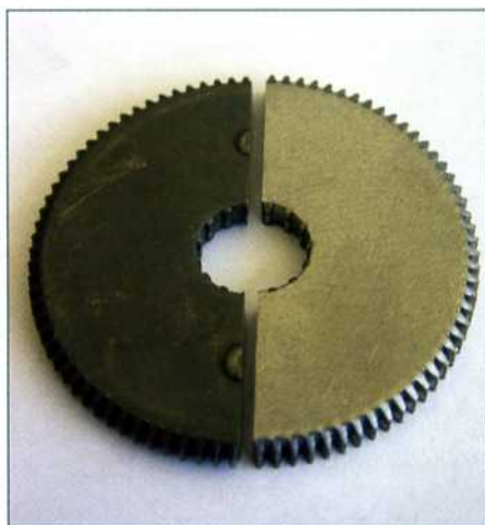
Durch das neue RE-Verfahren der Fritz Schiess AG erhöht sich der Traganteil der Zähne von herkömmlichen 60 - 70 Prozent (links) auf rund 90 Prozent der Fläche (rechts). Damit lassen sich nicht nur Arbeitsschritte, sondern auch Material einsparen.

Bei der Herstellung von Zahnrädern durch Stanzen oder Feinschneiden erhöht sich der Einzug an den Zahnflanken, je spitzer der Winkel wird. Das hat bei der Konstruktion von Zahnrädern Einfluss auf die Faktoren Durchmesser, Anzahl der Zähne und Materialstärke sowie deren Verhältnisse zueinander. So beschreibt Modul das Verhältnis zwischen Zahnradradius und Anzahl der Zähne. Bisher galt beispielsweise bei einem Modul von 1 (also z. B. 50 Zähne bei 50 mm Durchmesser) die Herstellung eines Zahnrades mit vier Millimeter Stärke als Grenze des Machbaren beim Stanzen oder Feinschneiden (entspricht 4-mal Modul). Wollte man dickere Zahnräder herstellen, musste man entweder die Anzahl der Zähne reduzieren oder zwei Zahnräder zu einem zusammenpressen. Durch das neue RE-Verfahren können die Experten der Fritz Schiess AG nun Zahnräder bis zu 8-mal Modul in einem Arbeitsgang fertigen. So lassen sich beispielsweise bei Modul 1 Zahnräder mit bis zu acht Millimeter Materialstärke in einem Arbeitsgang prozess-