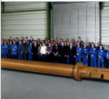
Der 13,40 Meter lange Zylinder beim Hersteller Storz.

Storz Hydrauliksysteme hat für ein Wasserkraftwerk nahe Leibstadt, Schweiz, einen übergroßen Hydraulikzylinder gebaut. Der 13,40 Meter lange Zylinder öffnet und schließt ein 210 Tonnen schweres Dammtor. Der Kolben weist einen Durchmesser von 490 Millimeter auf, erreicht eine Hublänge von 10,40 Meter und wiegt mehr als 20 Tonnen.