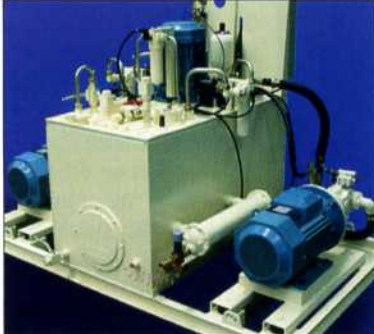
Maritimes Hydraulikaggregat von Scoda mit Atos-Edelstahlkomponenten.

Von Scoda kommen Edelstahl-Hydraulikaggregate für den Betrieb auf Schiffen. Diese sind mit vielen Edelstahlkomponenten von Atos ausgerüstet, einschließlich Magnet- und Proportionalventilen. In dieser Ausführung widerstehen die Aggregate Salznebelprüfungen von über 200 Stunden. Zum Betrieb werden biologisch abbaubare Flüssigkeiten verwendet.