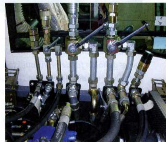
Die beiden autarken Hydraulik-Kreisläufe werden durch Kugelabsperrhähne sicher voneinander getrennt