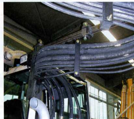
Die Führung der Hydraulikschläuche zwischen Bagger und Aggregat erforderte viel Kreativität