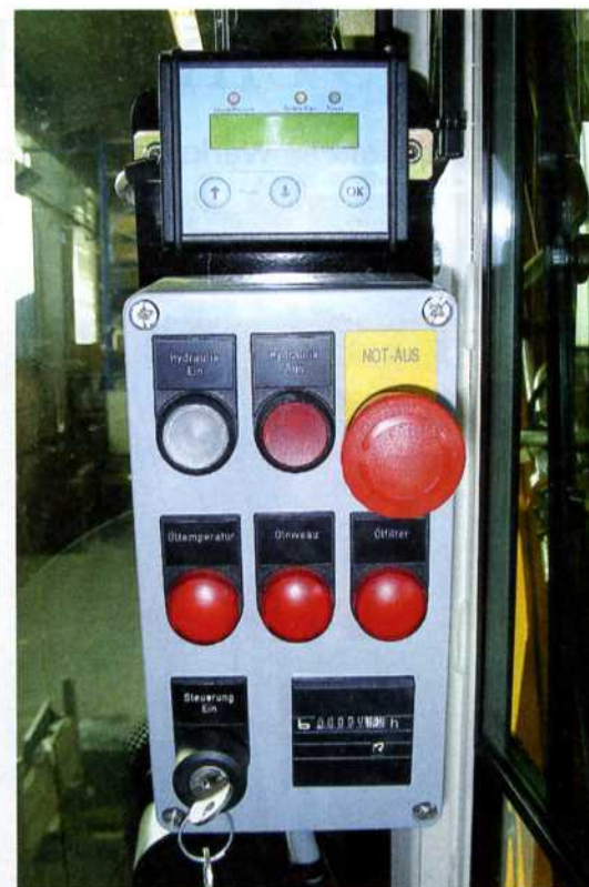
Bedienung des Hydraulikaggregats in der Baggerkabine