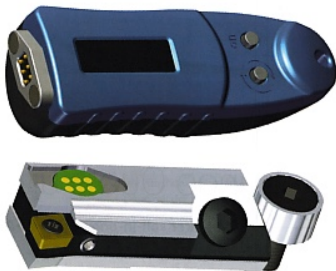
Der Kurz-klemmhalter lässt sich direkt auf der Maschine einstellen und bequem von aussen über das digitale Display kontrollieren.

Das externe Display ist einfach zu bedienen und für mehrere Kurz-klemmhalter anwendbar. Die Anzeige kehrt sich um, ähnlich wie bei Tablet und Smartphone, und kann immer richtigstehend abgelesen werden. Es lässt