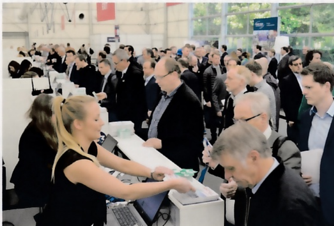
Под названием SOLIDS Dortmund 7 и 8 ноября пройдет важнейшее выставочное событие немецкого сектора переработки гранул, порошков и сыпучих материалов

Вместе с новым именем вводится и логотип SOLIDS Dortmund. Данной торговой маркой, имеющей логотип в виде трех наложенных друг на друга шестиугольных плоскостей, представлены три вида сыпучего материала, а именно камень, гранулы и порошок. Шесть углов символизируют шесть европейских отраслевых выставок SES. Широкое одо-