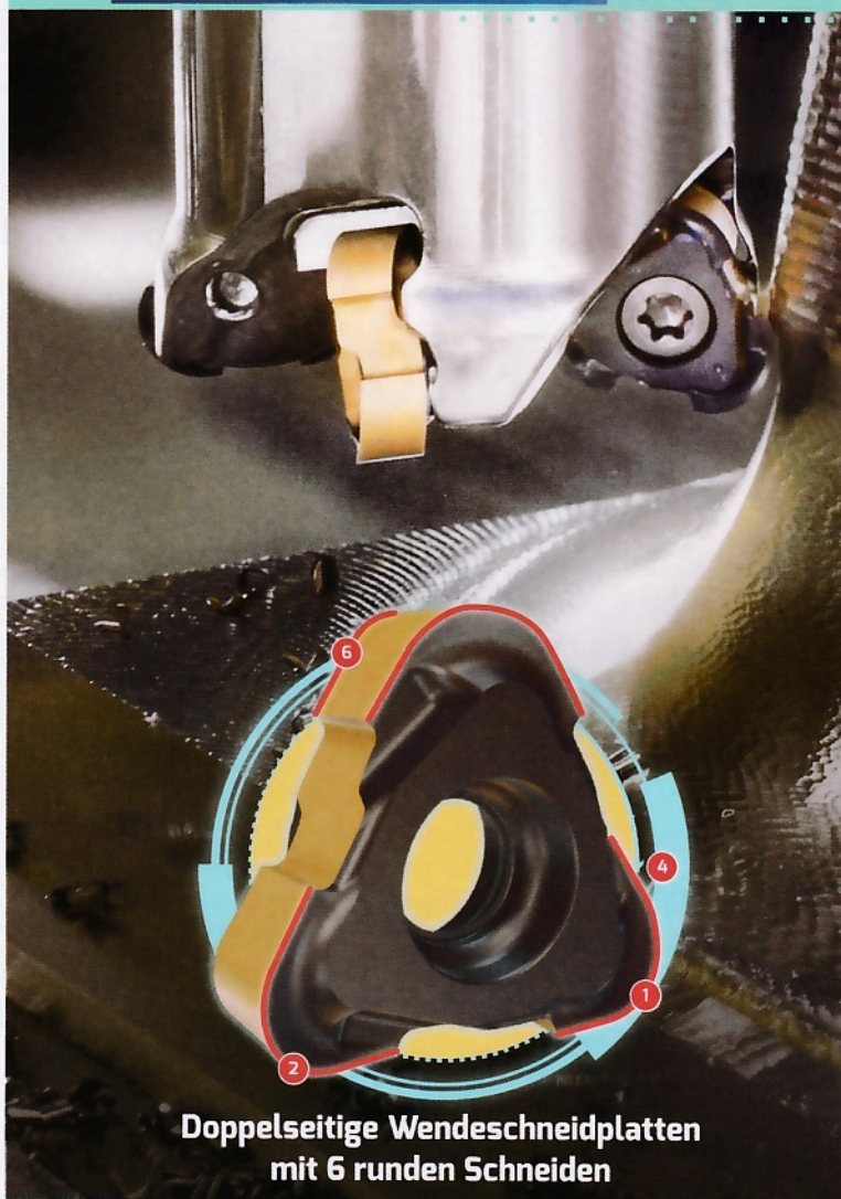
Doppelseitige Wendeschneidplatten mit 6 runden Schneiden