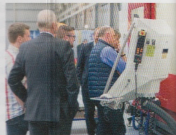
Die Hedelius-Hausausstellung lockte 600 Besucher nach Meppen