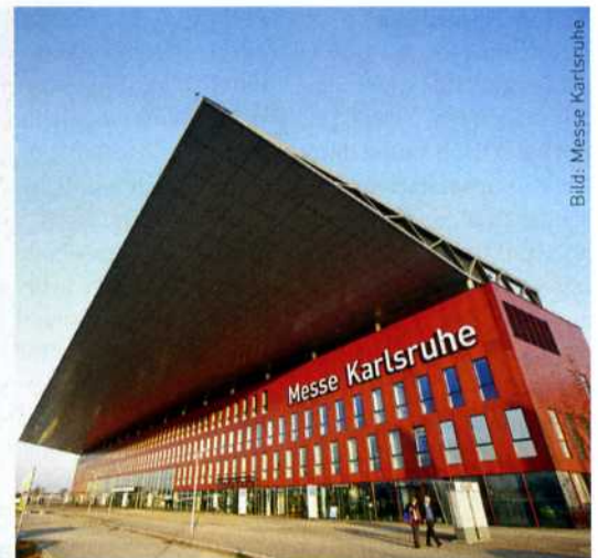
In Karlsruhe finden die Oberflächentechnik-Messen Paintexpo und Deburring Expo statt.

und gehört zu den Top Fünf weltweit. Bei der jüngsten Ausgabe vom 13. bis 17. September 2016 verzeichnete die AMB 1469 Aussteller (2014: 1357) und 86.166 Besucher (2014: 90.331). Von den Ausstellern kamen nach Angaben des Veranstalters 408 aus dem Ausland (2014: 359).