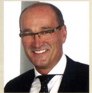
Norbert Gauß | © Yaskawa