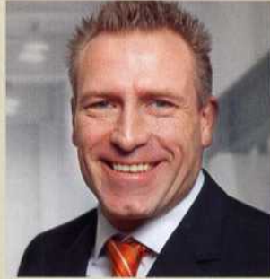
Thorsten Petry | © Konecranes