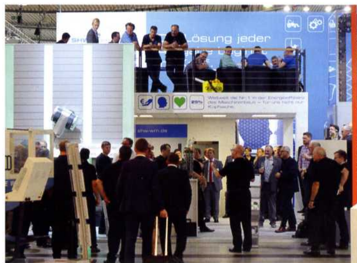
SHW-Standparty auf der AMB 2016