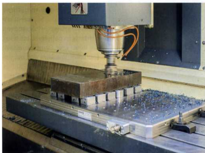
Die Vollmetall-Ausführung der ›Premium Line‹ Magnetspannplatten von AMF widersteht heißen Spänen und aggressiven Kühlschmiermitteln.