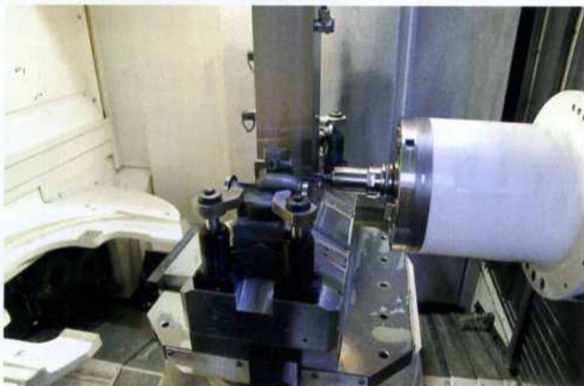
Bild 7: Auf dem Mazak BAZ werden die Pumpengehäuse abgelängt, plan gefräst und an der Außenseite mit einem Zollgewinde versehen

schnellen Wechsel ermöglicht. Auf ihr befinden sich die eben-