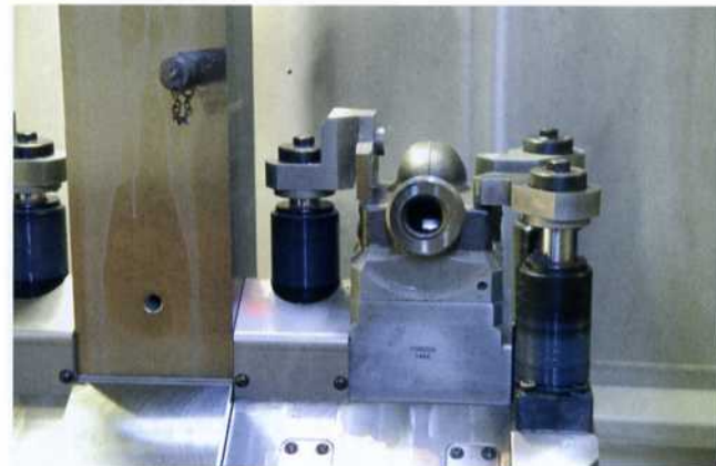
Bild 6: Hydraulisch betätigte Schwenkspanner spannen die Pumpengehäuse so, dass für Werkzeuge und Greifer der benötigte Freiraum bleibt

bohrt, in die anschließend ein M6-Gewinde geschnitten wird. Die DMG-Drehmaschine ist dafür mit einem Werkzeugrevolver mit zwölf Werkzeugen bestens ausgestattet. Blitzschnell und mit stets wiederkehrender Präzision erledigt die Maschine die Prozessschritte und schleust die fertig bearbeiteten Gehäuse heraus.