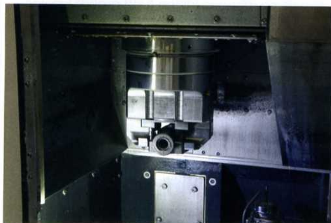
Bild 3: Ein 2-Backen Kraftspannfutter Modell KFD-G mit großem Backenhub, 90° Spitzverzahnung und zylindrischer Zentrieraufnahme spannt die Gehäuse auf der Drehmaschine

und Steuerelektronik verheiratet werden. Im Zentrum stehen dabei zwei Bearbeitungszentren, eine bereits vorhandene Drehmaschine von DMG sowie eine von der Wenk AG anwenderspezifisch bereitgestellte und in Betrieb genommene horizontale Fräsmaschine von Mazak mit Palettenwechselsystem. Die Röhm AG hat dafür federführend die Spannvorrichtung mitentwickelt, konstruiert und einbaufertig hergestellt. Sonder-