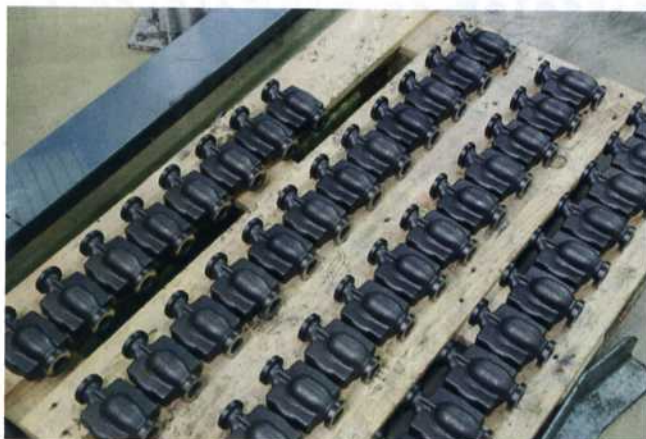
Bild 1: Pumpengehäuse für hocheffiziente Heizungs-Umwälzpumpen aus dem Biral-Sortiment