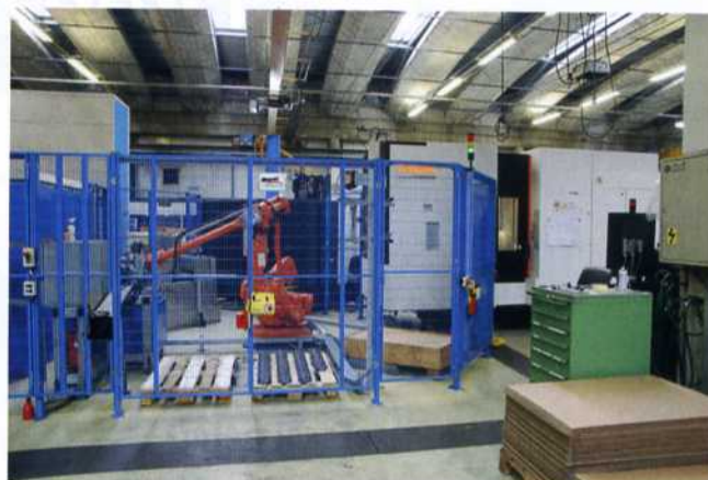
Bild 2: Seit 2014 produziert eine Fertigungszelle bei Biral vollautomatisiert Pumpengehäuse in Losgrößen zwischen 150 und 8.400 Stück