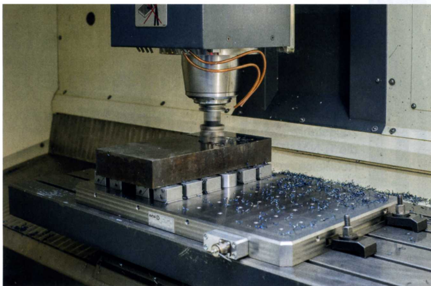
Bild: Die Vollmetall-Ausführung der neuen Premium Line Magnetspannplatten von AMF widersteht heißen Spänen und aggressiven Kühlschmiermitteln

Die Andreas Maier GmbH & Co. KG (AMF) präsentiert ein neues Magnetspannsystem für die Fräsbearbeitung. Kernstück ist die außergewöhnlich dünne Magnetspannplatte Premium Line mit Vollmetalloberfläche und leistungsstarker elektro permanenter Quadratpoltechnologie. Mit ihr lassen sich sehr hohe Haltekräfte realisieren.