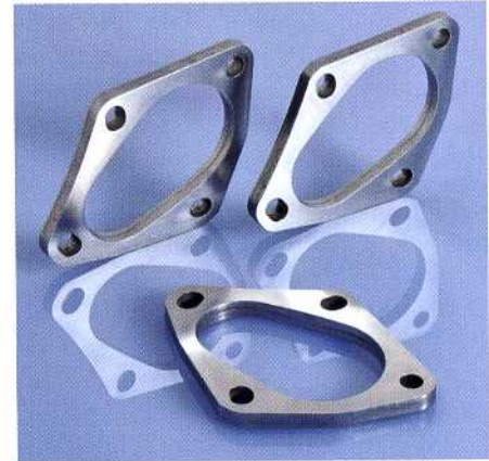
Stanzflansche für Automobile

Die Wolpert-Gruppe besteht aus sieben eigenständigen Unternehmen und stellt Prototypenwerkzeuge, Serienwerkzeuge sowie Serienteile her. Keimzelle des Verbundes ist die Wolpert Modell- und Formenbau AG in Bretzfeld. 1991 gegründet ist das Unternehmen durch technologische Entwicklungen und mehrere Firmenzukäufe stetig und beeindruckend gewachsen. Mit der Drei-Komponenten-Veredelungstechnologie und der Hybridtechnologie für das Umspritzen von Stahlteilen mit Kunststoff