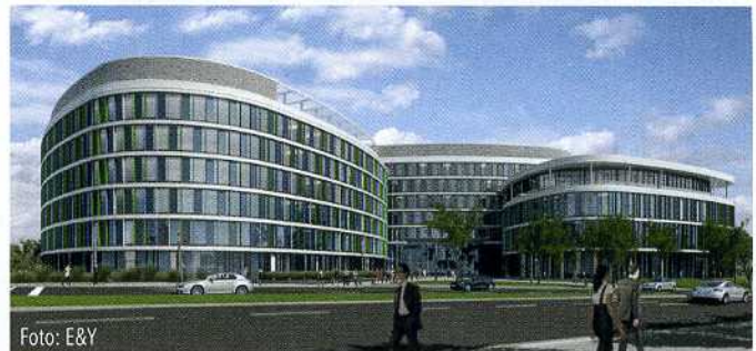
So soll die E&Y-Zentrale aussehen, wenn sie 2016 fertig ist.