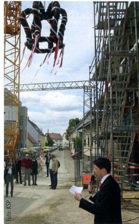
Richtfest der KSP-Filiale in Süßen.