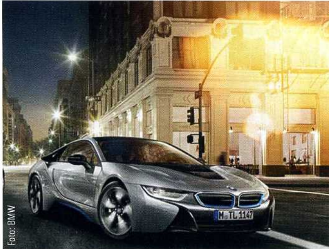
Die Produktivität steigt bei BMW dank Technik aus Schorndorf.

der Fertigung von Präzisionsteilen für die großen Umform- und Beschnittwerkzeuge zur Formung der Karosserieteile verdoppelten sie innerhalb eines Jahres die Produktivität. www.gfac.com