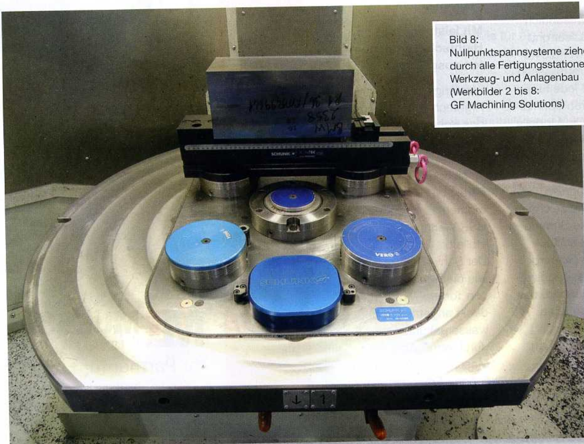
Bild 8: Nullpunktspannsysteme ziehen sich durch alle Fertigungsstationen bei BMW Werkzeug- und Anlagenbau

leisten die beiden Maschinen von GF Machining Solutions einen wichtigen Beitrag zur Produktivitätssteigerung bei BMW Werkzeug- und Anlagenbau München. Dementsprechend hat sich auch der Ausstoß erhöht. Wurden vor 2012 noch 770 Kleinteile jährlich gefertigt, waren es 2013 mit 1.550 Bauteilen mehr als doppelt so viele. Und für 2014 ist ein Output von 1.900 Teilen geplant. Herbert Winkler und Jürgen Heinzer ziehen ein positives Fazit: „Beim bisher erreichten Ergebnis unserer gesamten Optimierungsmaßnahmen haben uns die beiden Mikron HPM 1350U von GF Machining Solutions mit ihrer Leistungsfähigkeit, ihrer Präzision und ihrer Standfestigkeit positiv überrascht und unsere Kaufentscheidung eindrucksvoll bestätigt.“