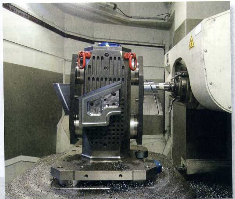
Bild 5: GF Machining Solutions hat die beiden MIKRON HPM 1350U angepasst auf die bei BMW übliche Trockenfräsbearbeitung