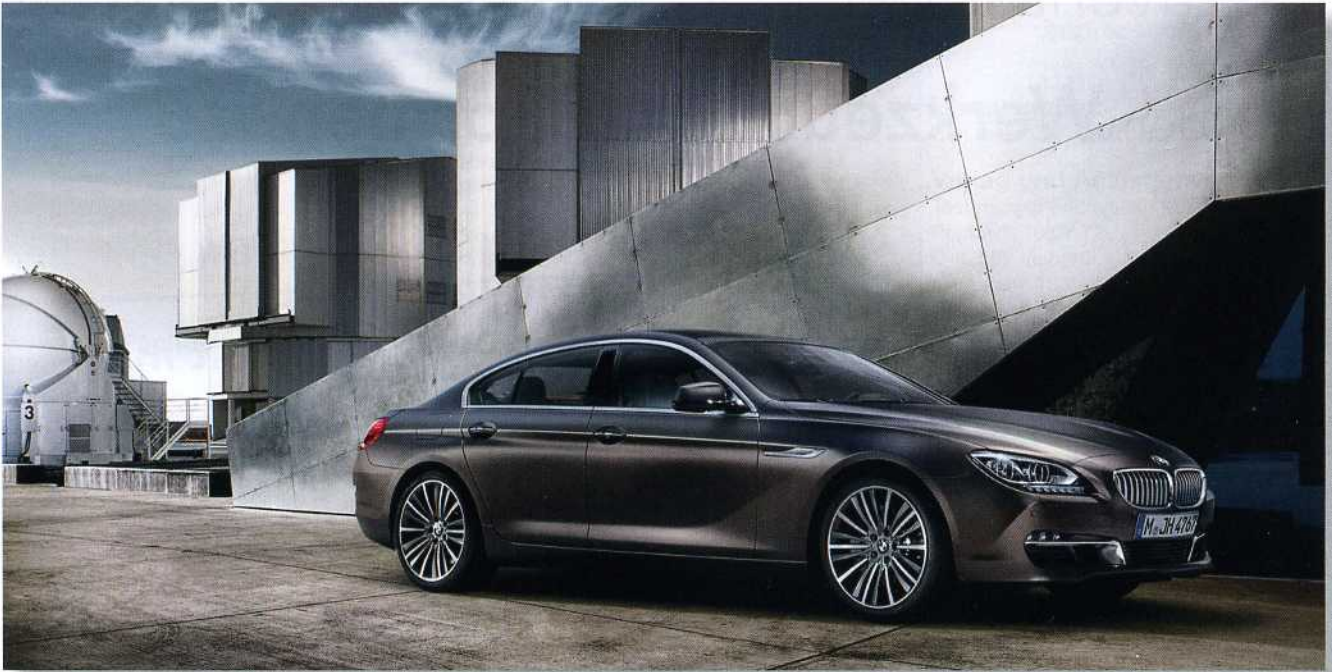
Bild 1: Der Werkzeugbau der BMW Group ist eng verzahnt mit der Entwicklung. Aufgaben sind die Realisierung, Fertigung und Einarbeitung komplexer Werkzeugsätze zur Herstellung von Karosseriebauteilen