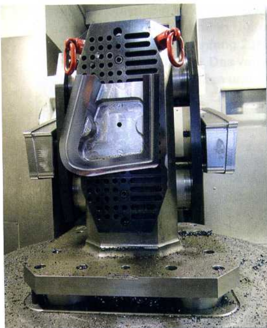
Bild 4: Aufspanntürme in den MIKRON Maschinen gehören mit zum Optimierungsspektrum

Eisenach stellt das Münchner Werk rund die Hälfte aller BMW-Werkzeuge selbst her. Die andere Hälfte fertigen Partnerunternehmen. In den drei Standorten verlassen jährlich etwa 500 Werkzeuge mit durchschnittlich vier bis fünf Arbeitsfolgen pro Werkzeugsätzen die Fertigungshallen.