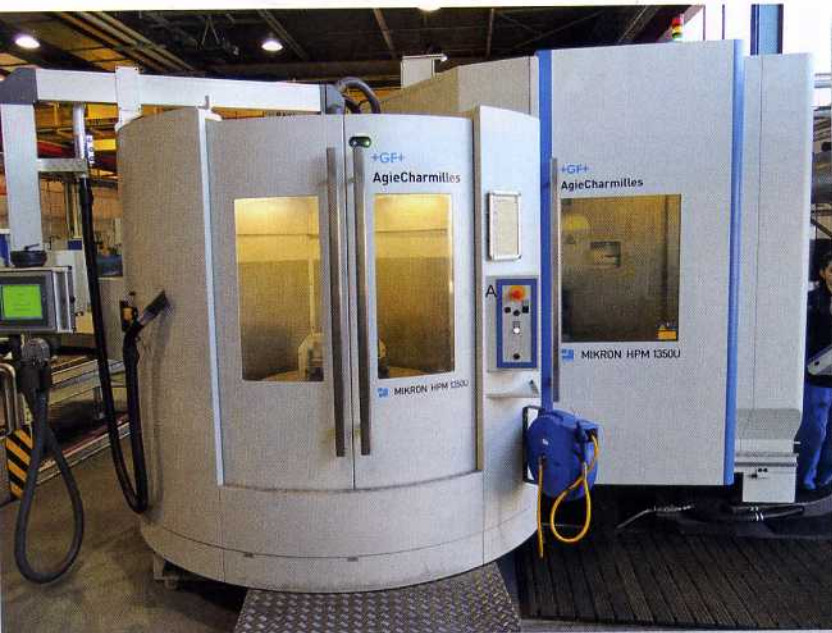
Bild 2: Bei der Herstellung der kleineren Bauteile für ein Werkzeug sorgen zwei MIKRON HPM 1350U von GF Machining Solutions mit Werkzeug- und Palettenwechsler für deutlich höhere Produktivität