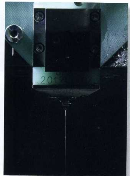
Bild 5: Der innovative und einzigartige Drahtwechsler AWC der CUT 2000 von GF Machining Solutions wechselt den Drahtdurchmesser automatisch während der Bearbeitung

Wire Changer) wechselt den Drahtdurchmesser automatisch während der Bearbeitung. Damit kann zuerst mit einem dicken Draht (z.B. 0,20 oder 0,25 mm) geschnitten und anschließend automatisch zu einem dünnen Draht gewechselt werden (z. B. 0,05, 0,07 oder 0,1 mm). Dadurch lassen sich bis zu 30 % der Bearbeitungszeit einsparen. Der absenkbare Arbeitsbehälter gestattet einen hervorragenden Zugang und ausgezeichnete Sicht auf die gesamte Arbeitszone. Da lässt sich dann bei abgeflossenem Dielektrikum sofort auch die hohe Oberflächenqualität erkennen. Die ist mit Ra 0,05 µm sehr gut und macht damit oftmals nachgelagerte Arbeitsschritte überflüssig.