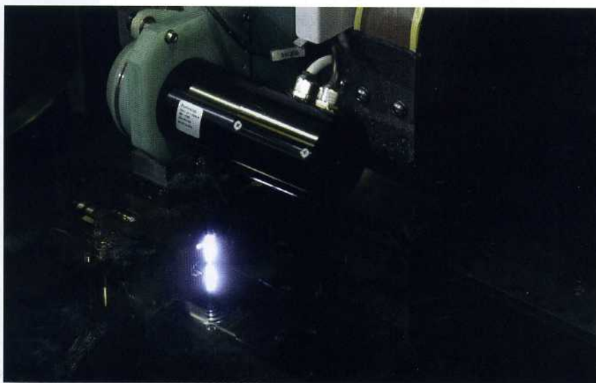
Bild 10: Die Oberflächenqualität ist nach dem Erodieren mit Ra 0,05 µm sehr gut und macht nachgelagerte Arbeitsschritte oft überflüssig (Werkbilder: GF Machining Solutions GmbH, Schorndorf)

thermischen Stabilität. Das hochentwickelte System kompensiert jegliche Temperaturschwankungen in einem nicht klimatisierten Arbeitsumfeld. Die Glasmaßstäbe an den X-, Y- und Z-Achsen sind ölgekühlt und „in ihrer Genauigkeit derzeit nicht zu übertreffen“, wie Seele versichert. Für wiederholgenaues Arbeiten sorgt schließlich der Generator IPG, dessen digitale Impulse zu verlässlichen Arbeitsergebnissen führen. Neben der Veröffentlichung der Doktorarbeit werden Forschungsergebnisse auf Wunsch auch den Partnern im Industriearbeitskreis Elektroerosive Bearbeitung (EAK des WZL) zur Verfügung gestellt. Darin arbeiten Unternehmen aus dem Bereich der Entwicklung und Herstellung von funkenerosiven Werkzeugmaschinen oder der eingesetzten Arbeitsmedien und Elektrodenwerkstoffe sowie produzierende Endanwender zusammen. Nicht nur diese vertrauen auf die zuverlässige und präzise Arbeitsweise der FORM 2000 von GF Machining Solutions, sondern auch Patienten, die eine Operation weniger ertragen müssen, weil deren Knochenimplantat sich zukünftig selbst auflösen wird.