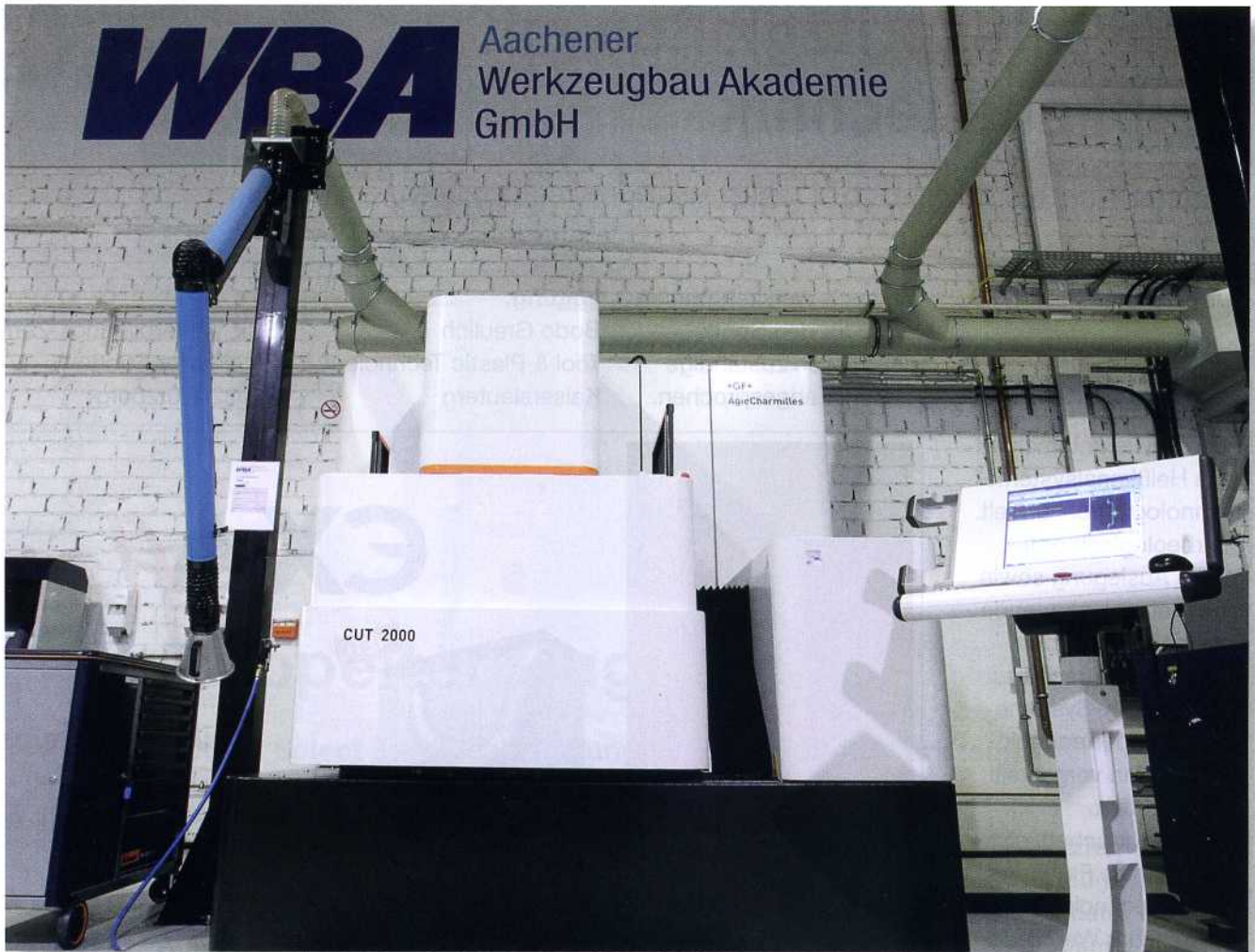
Bild 1: Beim Drahterodieren setzt die WBA seit 2011 auf eine CUT 2000 von GF Machining Solutions