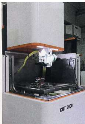
Bild 2: Der absenkbare Arbeitsbehälter der CUT 2000 von GF Machining Solutions gestattet einen hervorragenden Zugang und ausgezeichnete Sicht auf die gesamte Arbeitszone