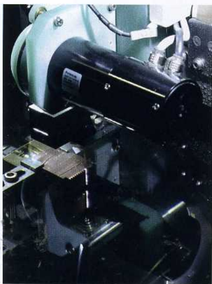
Bild 9: Mike Brinkmann, Technischer Betriebsleiter der WBA: „Wir schätzen die hohe Präzision der Maschine und die Wiederholgenauigkeit“

Im Rahmen seiner Dissertation im Fach Maschinenbau wird Schwade durch seine Forschungstätigkeiten Empfehlungen für das Erodieren von Magnesium erstellen. Hierzu gibt es mit der Funkenerosion noch keine Erfahrungswerte. Aus dem Werkstoff sollen später passgenaue biodegradierbare Implantate hergestellt werden können, die sich selbst auflösen. In ein Probewerkstück werden mittels einer Senkelektrode 0,4 bis 0,8 mm große Kanäle eingebracht, deren Oberflächen später noch durch einen Anodisierprozess der Firma Meotec in Aachen gezielt umgewandelt werden. Durch solche Kanäle soll später organisches Knochenmaterial einwachsen und das Implantat aus Magnesium nach und nach überflüssig machen. Das löst sich durch normale Oxydation auf und schafft so Platz für das natürliche, nachwachsende Knochenstück. Um die Testreihe möglichst klein zu halten und schnell brauchbare Empfehlungswerte zu gewinnen, werden an der Senkerodiermaschine FORM 2000 Spannung und Strom abgegriffen und gemessen.