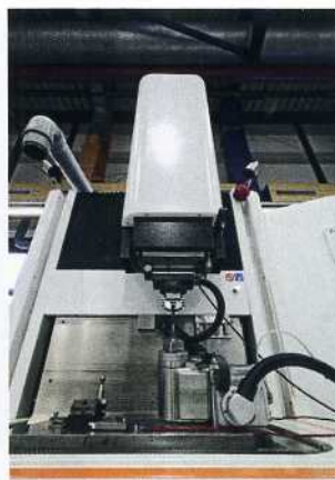
Bild 3: Um die Testreihe möglichst klein zu halten und schnell brauchbare Empfindungswerte zu gewinnen, werden an der Senkerodiermaschine Form 2000 Spannung und Strom abgegriffen und gemessen

wenn beispielsweise für einen Automobilhersteller streng geheim neue Verfahren für Teile der übernächsten Fahrzeuggeneration erprobt werden.