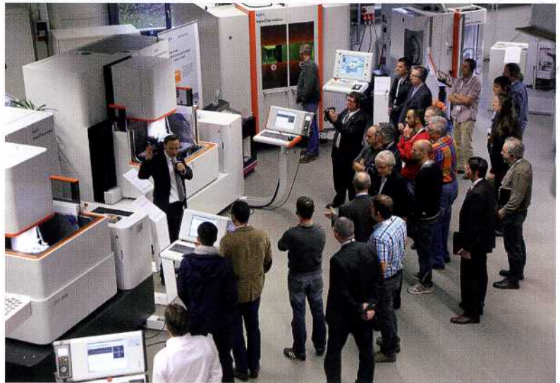
Rund 350 Gäste, Kunden und Interessenten aus 13 Ländern bestaunten bei den „EMOTION Days“ vier Weltneuheiten und insgesamt 25 Maschinen.

Zu den vorgestellten Neuheiten gehören die Drahterodiermaschine „CUT 2000S“, das Basismodell für das Senkerodieren „Form 20“, die 5-Achs-Fräsmaschine „Mikron HEM 500 U“ sowie die „HSM 200 U LP“. Als 3- oder 5-Achs-Maschine mit Steuerung von Heidenhain und mit Wechsler für bis zu 140 Werkzeuge erhältlich, liefert sie bis auf 2 µm genaue Ergebnisse. Durch eine neuartige Konstruktion, bei der alle Achsen unabhängig an einem ein-