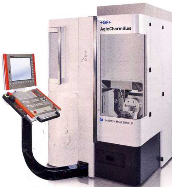
Für hochpräzise Ergebnisse auf kleinstem Raum sorgt die HSM 200 U LP