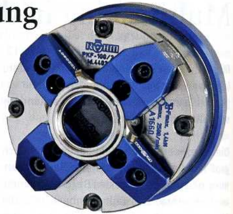
4-Backen-Futter zum Spannen von Uhrengehäusen

Eine weitere Branche, auf die sich die Sontheimer konzentrieren, ist die Öl- und Gasindustrie. Dort ermöglichen verschiedene Varianten der pneumatischen Vorderendfutter LVE das Spannen von Rohren mit großem