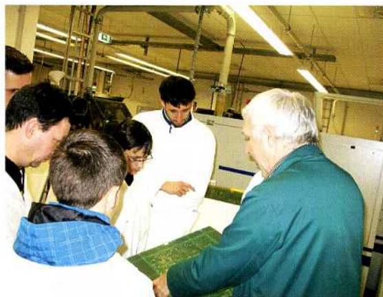
Orientierung für die berufliche Zukunft stand im Mittelpunkt eines Tags der offenen Tür.

In der „Woche der offenen Unternehmen im Erzgebirgskreis“, Bild , bot die KSG Leiterplatten GmbH, Gornsdorf ( www.ksg.de ), im März 2013 interessierten Schülerinnen und Schülern bei einem Betriebsrundgang einen Einblick in die hochmoderne Fertigung an. Dabei gab es auch Informationen zu den unterschiedlichen Ausbildungsberufen wie Industriemechaniker, Oberflächenbeschichter, Mikrotechnologie, Mechatroniker und Elektroniker sowie „Duales Studium“ für alle Produktionsbereiche und zum Qualitätsmanagement. Aktuell bildet KSG 29 „Azubis“ aus. Bis jetzt schlossen