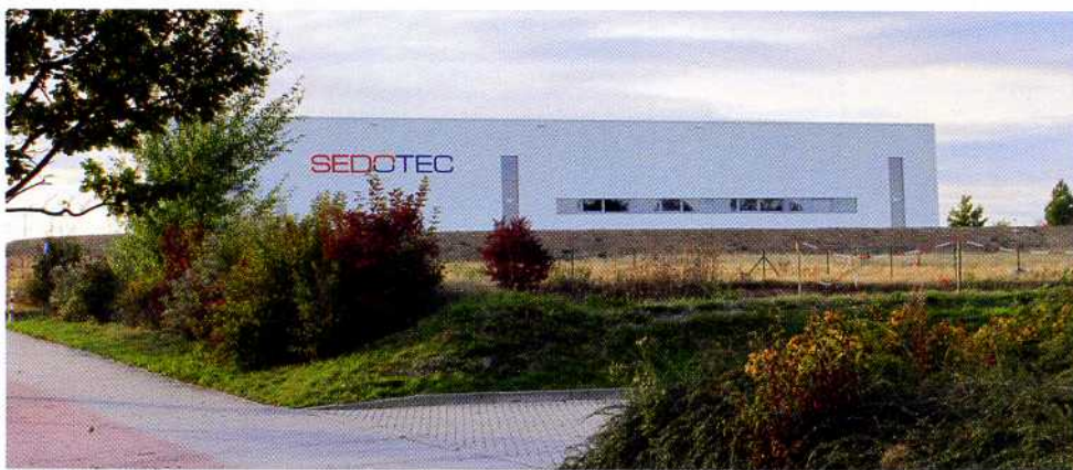
Im neuen Fertigungszentrum in Mittweida hat der Zulieferer Sedotec ein modernes Lean-Benchmark-Fertigungskonzept umgesetzt und die Zahl der Arbeitsplätze um weitere 6 auf über 20 erhöht

INFO Sedotec GmbH & Co. KG, Ladenburg, www.sedotec.de