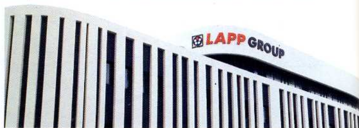
Lapps neues Werk befindet sich im Lingang Industrial Park nahe Shanghai

ERWEITERUNG. Die Stuttgarter Lapp-Gruppe wird ihre Präsenz in China weiter verstärken: Noch in diesem Frühjahr geht ein eigenes Produktionswerk des Kabelspezialisten in China an den Start. Das neue Fertigungsgebäude von Lapp Cable Works Shanghai Co., Ltd., befindet sich im Südosten von Shanghai im Lingang Industrial Park. Es umfasst eine Bruttogeschossfläche von mehr als 11000 m 2 . Im Gebäude ist noch Platz für weiteres Wachstum vorhanden, wie es von Unternehmensseite heißt. In direkter Nachbarschaft haben sich Firmen wie Siemens, Caterpillar, Atlas Copco oder Lenze niedergelassen, aber auch namhafte chinesische Hersteller wie Shanghai Electric und SAIC Motor. Vorstandsvorsitzender Andreas Lapp: »Wir sind seit 1999 in China aktiv und haben dort viele Kunden aus den Bereichen Automatisierung, Maschinenbau und Fahrzeugbau. Mit der neuen Produktionsstätte können wir unsere Kunden