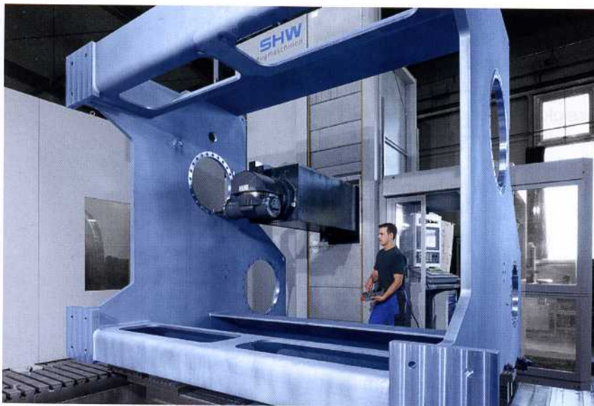
Bild 3: Kernstück der Maschinen ist der kompakte und kraftvolle Orthogonal-kopf, der 64.800 Positionen schnell und positionsgenau anfahren kann. Der Spindelstock der Uni-Force 6 fährt in Z-Achsen-Richtung bis 1.600 mm aus

verfahren. Mit Abmessungen von bis zu 3 x 3 x 3 m können somit bei Kienle auch die größten Gestelle bearbeitet werden. In deren Stahlwände werden für die spätere Aufnahme und Lagerung der Seiltrommeln verschiedene runde Öffnungen passgenau gefräst. Die UniForce 6 von SHW-Werkzeugmaschinen ist eine Fahrständermaschine, die besonders für große Werkstücke geeignet ist. Äußerst flexibel und präzise auf langen Fahrwegen, eignet sie sich auch für den Werkzeugbau und die Herstellung von Einzelteilen und Kleinserien des Maschinenbaus, wie sie bei Kienle