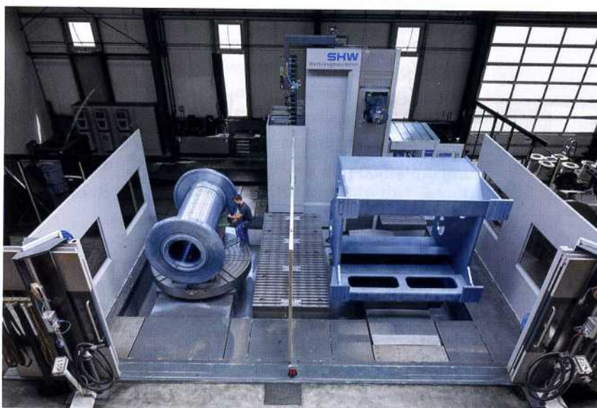
Bild 4: Besonders schätzen die Kienle-Mitarbeiter die sehr gute Zugänglichkeit der Maschine und des Arbeitsraums

ebenfalls gefertigt werden. Das Maschinenkonzept ermöglicht die Bearbeitung sperriger und komplexer Teile in einer einzigen Aufspannung. Der Arbeitsbereich misst bis zu 40.000 mm in der X- und 4.100 mm in der Y-Achse. Der Spindelstock fährt in Z-Achsen-Richtung bis 1.600 mm aus. Direkte Wegmesssysteme sorgen dafür, dass die Kugelgewindetriebe mit AC-Servomotoren schnell und positionsgenau verfahren. Bei der Kienle-Maschine beträgt der Verfahrweg in der X-Achse 8.000 mm. Besonders schätzen die Kienle-Mitarbeiter in der täglichen Arbeit die sehr gute