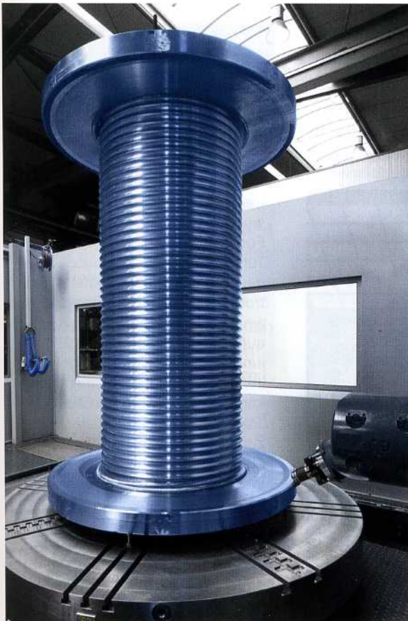
Bild 2: Auf dem Dreh-Fräsbearbeitungszentrum von SHW-Werkzeugmaschinen fertigt die Kienle GmbH Seiltrommeln, die in Kränen, beispielweise auf Ölbohrinseln, Förderplattformen oder in Containerhäfen zum Einsatz kommen

aufgespannt. Auf einem ebenfalls mitgelieferten motorisch angetriebenen CNC-Einbau-Rundtisch mit 2.500 x 2.000 mm Auflagefläche können die großen Gestelle für die Seilwinden aufgespannt werden. Beide Tische lassen sich in W-Achsen-Richtung um 1.500 mm