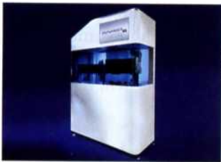
Bild: Zeltwanger Keime fertigt. Zeltwanger hat die Array-Druck-Fertigungsanlage geplant, konstruiert und gebaut sowie die Umgebung in den Kammern, die laminare Strömung und das Präzisionshandling vereint.

Für Schnelltests auf multiresistente Keime