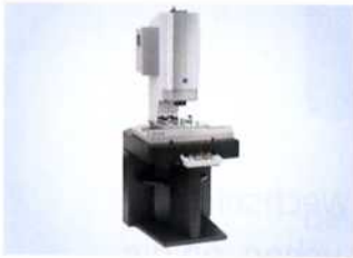
optisches Messen. Das Messvolumen beträgt 300 mal 200 mal 200 Millimeter. Die optische und taktile Sensorik ist fest eingebaut, die 3D-CAD-Software „Calypso“ führt die Messdaten zusammen.

Für die Messung kleiner Bauteile bietet Carl Zeiss die „O-Inspect 322“ an. Das kleine Gerät vereint taktiles Zeiss Scanning und