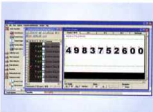
Mit einer Geschwindigkeit von bis zu 102 Bildern pro Sekunde sucht das Tool die Zeichen automatisch im Bildfeld, erkennt und liest sie. Anschließend werden Qualitätsmerkmale und Zeichenanzahl ausgegeben.

Der „OCR-/OCV“-Befehl der „EyeVision“-Software von EVT ermöglicht, Textzeichen z. B. auf Ampullenetiketten zu verifizieren.