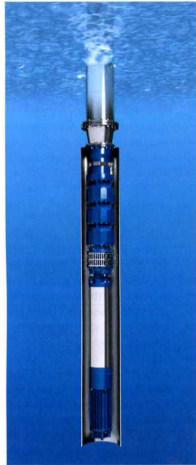
Unterwassermotorpumpen von ANDRITZ Ritz erfüllen weltweit höchste Zertifizierungsanforderungen.