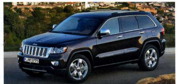
Mit den neuen Jeep-Modellen hat Kummich sein Fahrzeugangebot nach oben erweitert.

Eine große Zahl an Fahrzeugen, auch für Probefahrten, steht bereit. Somit können jetzt neben JEEP auch andere Chrysler-Modelle im Service betreut werden. Aber auch die Ausstellungen in Aalen, Michelfeld und Köngen wurden umgestaltet.